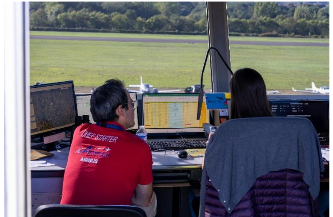
Une tour de contrôle en pleine veille