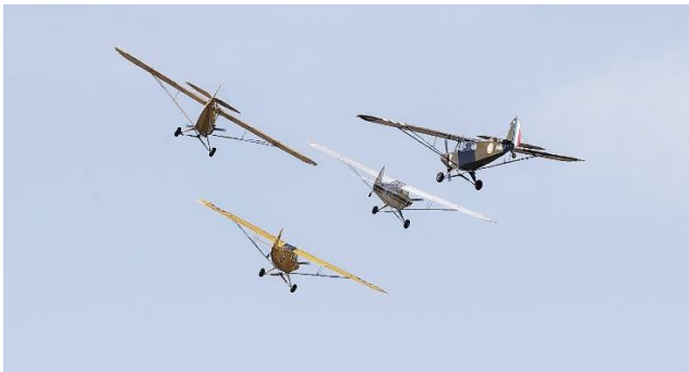
Crazy Piper team France