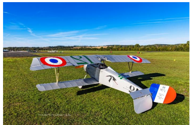
Réplique de Nieuport

Et plein d'autres jolies photos sur notre site https://vamp-gap.fr