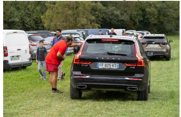
Le flux incessant et dense des véhicules