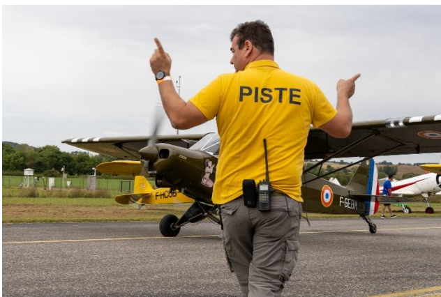
Un pistard au travail