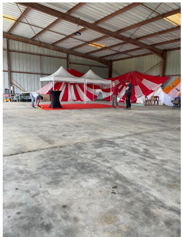
Préparation de la zone VIP

Rangement hangar. L'accueil de public sur un site particulier impose nécessairement la propreté de celui-ci. Notre hangar devenant le lieu de réception des VIPs à l'occasion de Gers Aéro passion 2025, un grand nettoyage de celui-ci a été entrepris ainsi qu'une séance de tri et rangement des divers "armoires et périphériques" remisés le long du bardage. Nous avons ainsi pu recevoir dignement autour d'un buffet bien garni tous nos invités particuliers venus assister à cette manifestation.