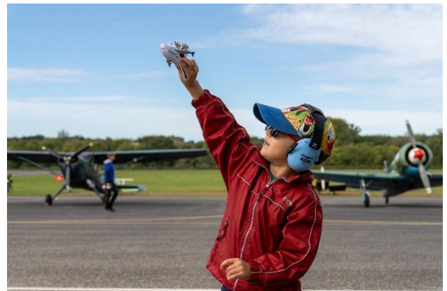
Une vocation naissante

Les objectifs de cette toute nouvelle manifestation aérienne étaient pour partie de faire mieux connaître cet aéroport gersois que beaucoup de régions nous envie, pour autre partie de réunir les passionnés d'aviation comme les non-initiés, petits comme grands et les faire vibrer au rythme des présentations et enfin de donner plus de visibilité sur les actions de notre association. Le public gersois a découvert ainsi pourquoi les oiseaux chantent et il semble que beaucoup de vocations aient pris naissance au travers de cette fenêtre sur les métiers de l'aéronautique. Notre but ultime a donc été atteint.