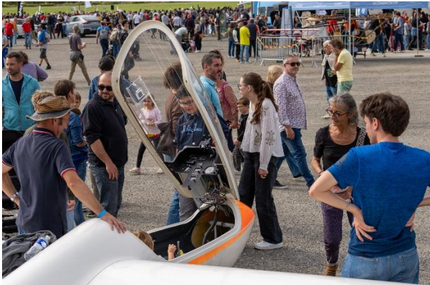
Comment ça vole