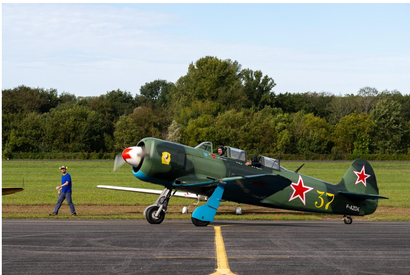
Le Yak 11 au meeting Gers Aéro Passion 2025