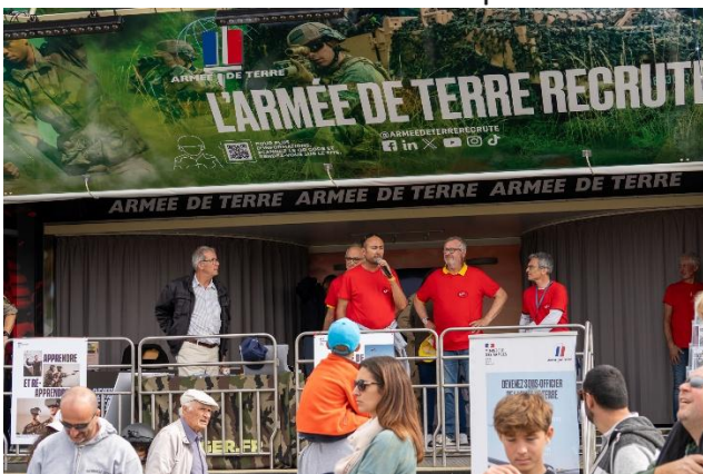
Car-podium Armée de Terre

En effet, l'accueil d'un tel public est assujéti à bon nombre d'impératifs de sécurité de bon sens et inévitablement réglementaires. En cela, nous avons été très fortement et heureusement soutenus par les collectivités locales au travers des services de la mairie (barriérage, mobilier itinérant, etc..), du conseil départemental 32 (signalétique voirie), du Commissariat de Police local (gestion de la circulation sur la N21), des Pompiers du SDIS et d'EFORSA sans oublier le concours de l'association locale de la Sécurité Civile et enfin par l'Armée de Terre avec son car-podium.