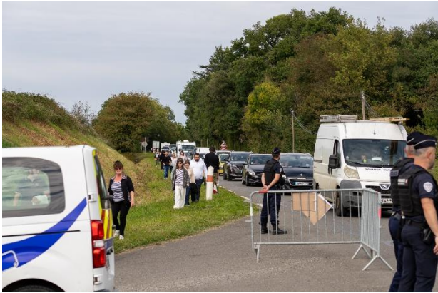
la N21 saturée