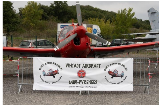
Notre MS 733 lors de Gers Aéro Passion 2025

pour la Sécurité de l'Aviation Civile) et l'obtention de son coup de tampon sur les documents avions.