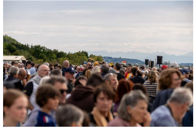
Une foule nombreuse